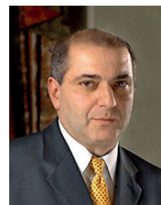
Гарегин Ашотович ТОСУНЯН Президент Ассоциации российских банков