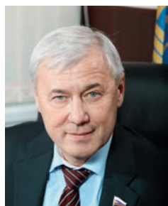
Анатолий Геннадьевич АКСАКОВ Председатель комитета Госдумы по финансовому рынку