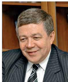
Руслан Семенович ГРИНБЕРГ Директор Института экономики РАН